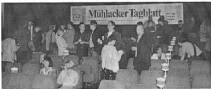
Am Mittwochabend gab's im Mühlacker Kino für Geschäftsleute und Freunde des Verlags im Voraus eine feierliche Präsentation der MT-Werbung.